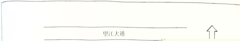
附图 1: 采样点位示意图