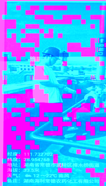
经度：111.732702 纬度：28.954768 地址：湖南省常德市武陵区樟木桥街道 海拔：33.5米 天气：☁️ 12~22℃ 南风 备注：湖南海利常德农药化工有限公司