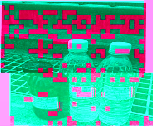
备注：湖南海利常德农药化工有限公司